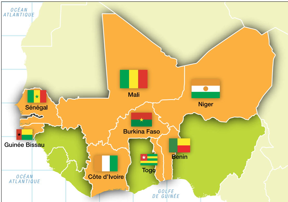
Figure 1: Les huit pays de l'UEMOA

Les ressources forestières, qui représentent 73% de l'énergie primaire de la région, peuvent être utilisées de façon différente pour créer des carburants plus efficaces et plus propres. Les mauvaises pratiques forestières doivent être inversées car elles sapent la gestion durable de la forêt ainsi que les programmes de reforestation. Les déchets et les rejets de l'agriculture peuvent s'ajouter à ces ressources en biomasse. Les cultures bioénergétiques locales peuvent être utilisées pour produire des biocarburants, favorisant ainsi l'accès à l'énergie, créant plus d'emplois, et générant des revenus pour les agriculteurs. Par des choix et politiques appropriés, l'utilisation de la bioénergie peut également réduire les émissions de gaz à effets de serre.